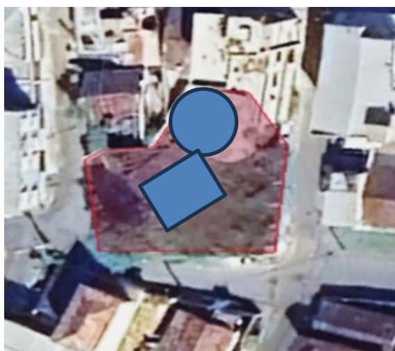
Imagem 1: Detalhe das envoltórias dos reservatórios existentes.

Estudo realizado pelo SAAE em 2018 verificou que o volume de reservação de água do subsistema é insuficiente para manter o abastecimento constante da comunidade, exigindo um contínuo bombeamento, sem o qual o resultado imediato é o desabastecimento dos bairros.