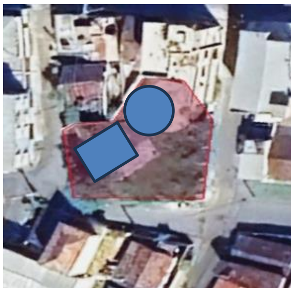
Imagem 1: Detalhe das envoltórias dos reservatórios existentes.

Atualmente o abastecimento é realizado a partir dos dois reservatórios existentes no bairro Estrela do Sul, ambos no modelo enterrado e construídos em concreto. Um dos reservatórios tem seção circular e capacidade de 150 m 3 , o outro tem seção retangular e capacidade de 50 m 3 . Os dois reservatórios veem apresentando desgastes naturais devidos ao tempo, com perdas de água verificadas.